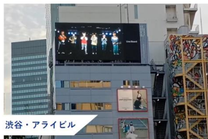
渋谷・アライビル