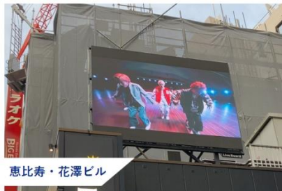
恵比寿・花澤ビル