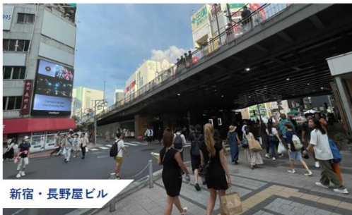
新宿・長野屋ビル