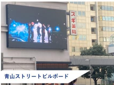
青山ストリートビルボード