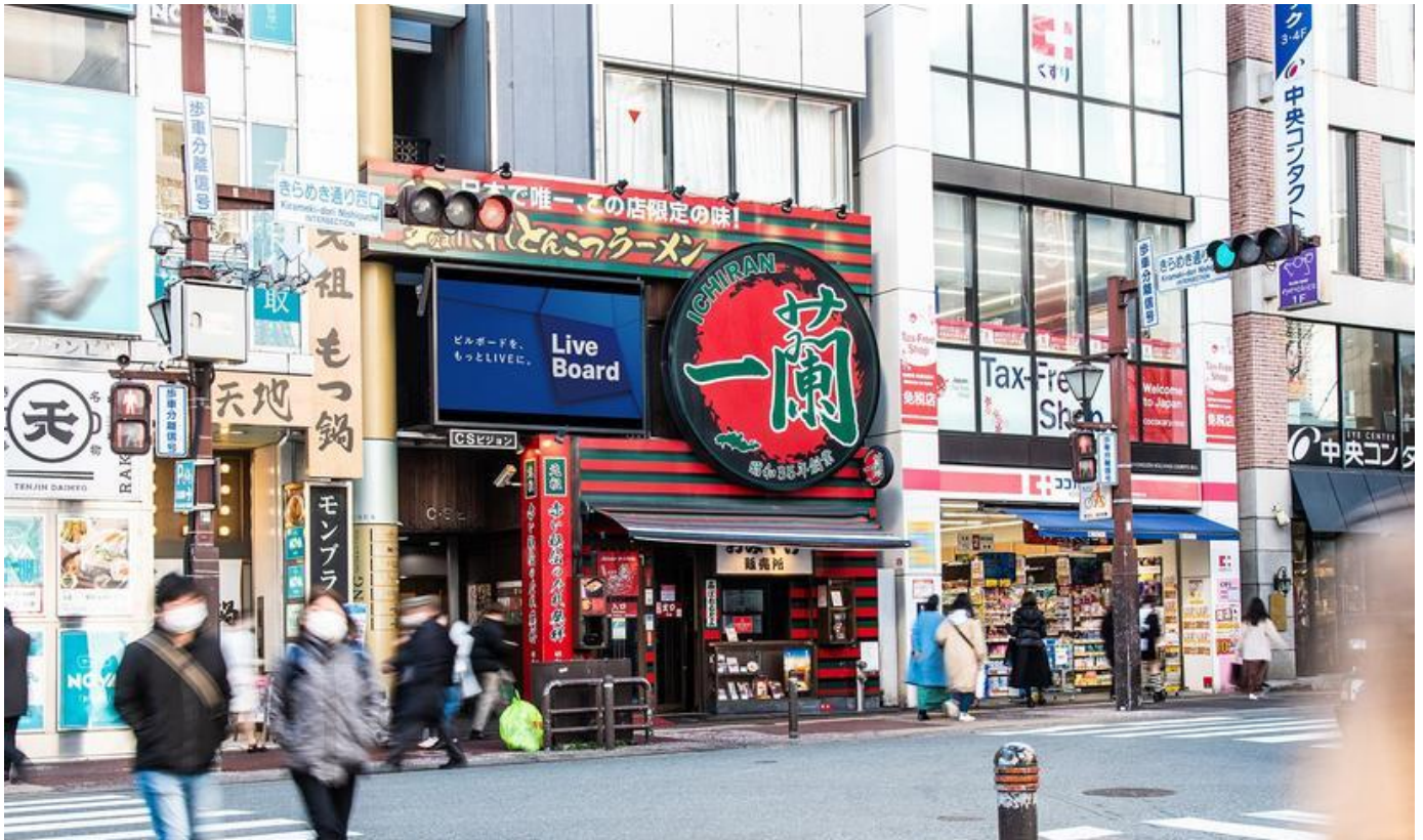
福岡県・天神 CS ビジョン

株式会社 LIVE BOARD（本社：東京都渋谷区、代表取締役社長：櫻井 順 以下、LIVE BOARD）は、NTT ドコモの「docomo Sense TM ※1（旧名、顧客理解エンジン）」や「docomo data square ® ※2」等を活用し、LIVE BOARD 屋外ビジョンにおける分析を実施しています。タクシーを活用する人＝ビジネスパーソンというイメージがありますが、実際にタクシー利用率が高い人がいるエリアはどこなのでしょう？そこで今回は、LIVE BOARD ネットワークの対象となる全国約 110 の屋外ビジョンから “タクシー利用率が高い人” がいるビジョンをランキング化しました。