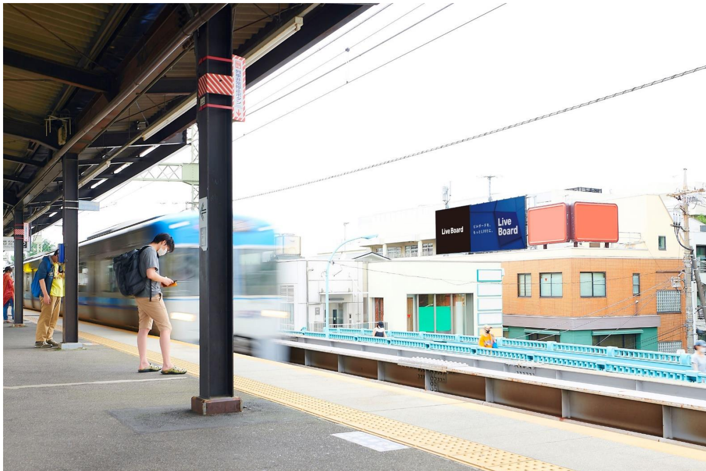
東京都・高井戸 藤ビル

株式会社 LIVE BOARD（本社：東京都渋谷区、代表取締役社長：櫻井 順 以下、LIVE BOARD）は、NTT ドコモの「docomo Sense™※1（旧名、顧客理解エンジン）」や「docomo data square®※2」等を活用し、LIVE BOARD 屋外ビジョンにおける分析を実施しています。気温も上がり暑さの厳しい季節となりました。暑い日には冷たい物が欲しくなりますが、アイスクリームを買う機会も多くなるのではないのでしょうか。そこで今回は、LIVE BOARD ネットワークの対象となる全国約 110 の屋外ビジョンから “アイスクリームが好きな人” が多いビジョンをランキング化しました。