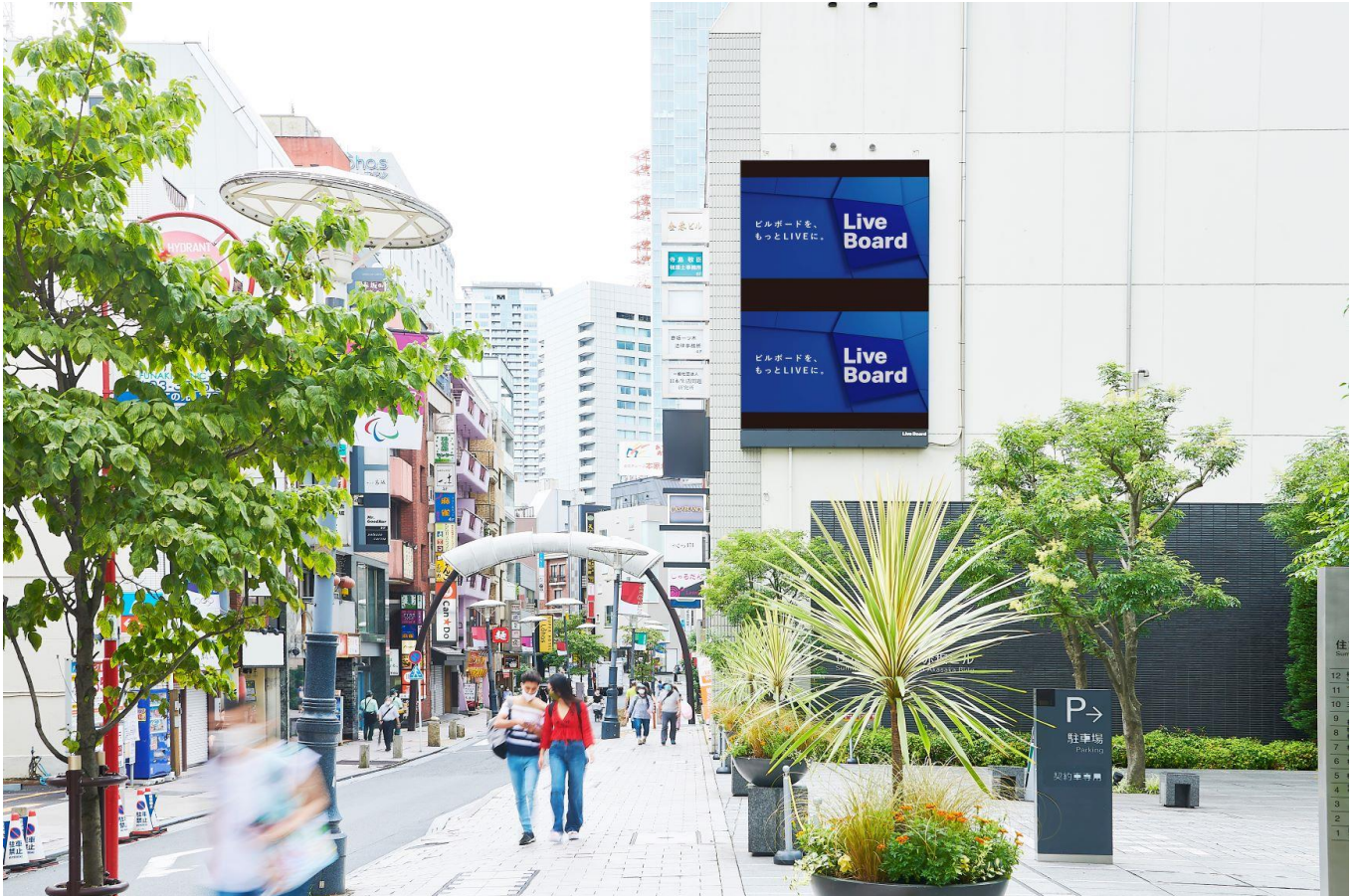
東京都・赤坂見附 金春ビル

株式会社 LIVE BOARD（本社：東京都渋谷区、代表取締役社長：櫻井 順 以下、LIVE BOARD）は、NTT ドコモの「docomo Sense TM ※1（旧名、顧客理解エンジン）」や「docomo data square ® ※2」等を活用し、LIVE BOARD 屋外ビジョンにおける分析を実施しています。夏は室内外の温度差などで体調を崩すこともあります。夏バテ解消には適度な運動をすることも良いとされており、暑さを乗り切るために体を動かすことは効果的です。そこで今回は、LIVE BOARD ネットワークの対象となる全国約 110 の屋外ビジョンから“スポーツジム・ヨガスタジオに通っている人”が多いビジョンをランキング化しました。