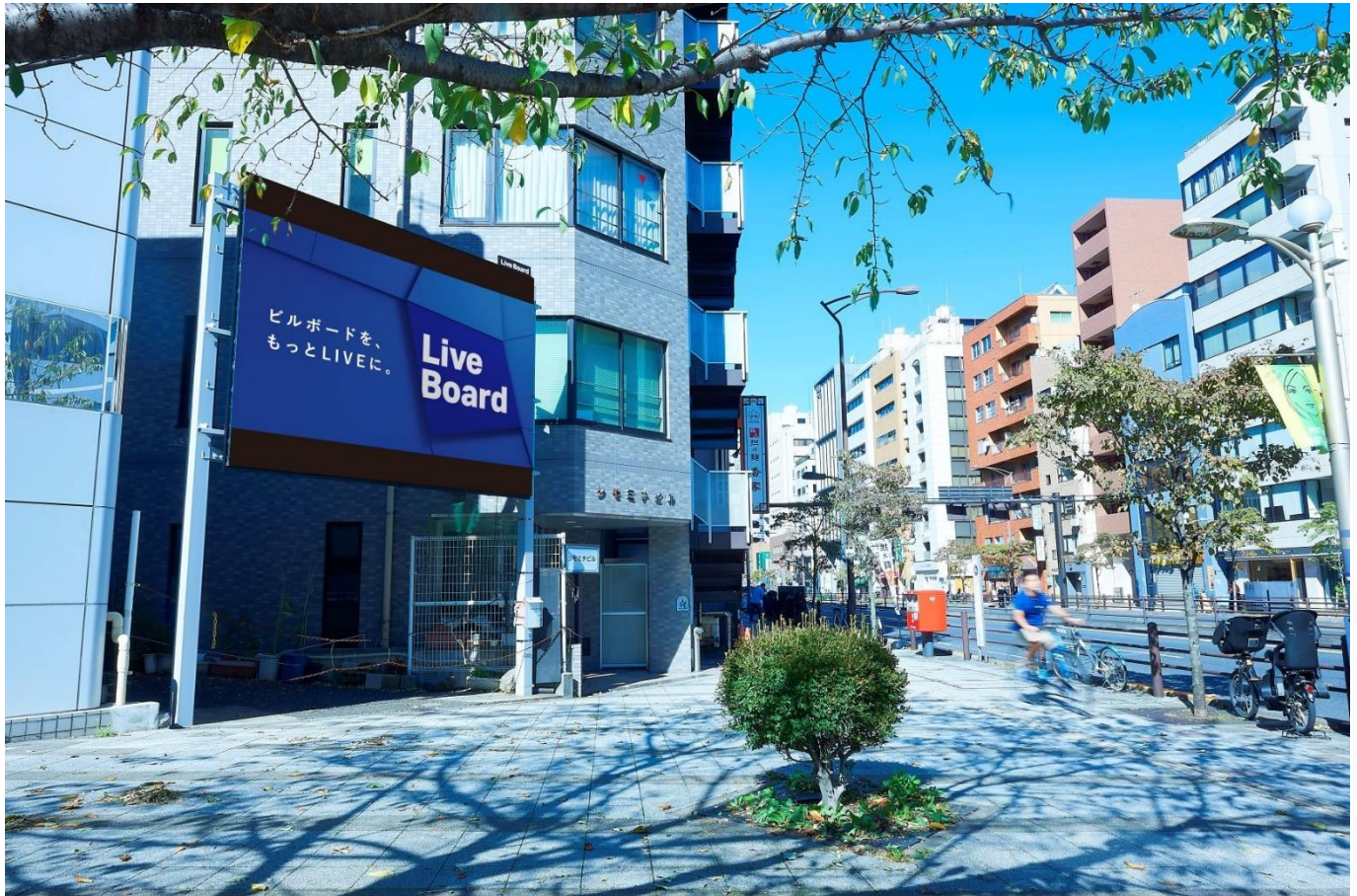
東京都・三田 安田 PK

株式会社 LIVE BOARD（本社：東京都渋谷区、代表取締役社長：櫻井 順 以下、LIVE BOARD）は、NTTドコモの「docomo Sense TM ※1（旧名、顧客理解エンジン）」や「docomo data square ® ※2」等を活用し、LIVE BOARD 屋外ビジョンにおける分析を実施しています。ハロウィンやクリスマスのシーズンは装飾やイルミネーションで街が賑やかに彩られます。テーマパークなどでも期間限定のイベントを開催しており、多くの来場者が訪れる季節です。そこで今回は、LIVE BOARD ネットワークの対象となる全国約110の屋外ビジョンから“テーマパークが好きな人”が多いビジョンをランキング化しました。