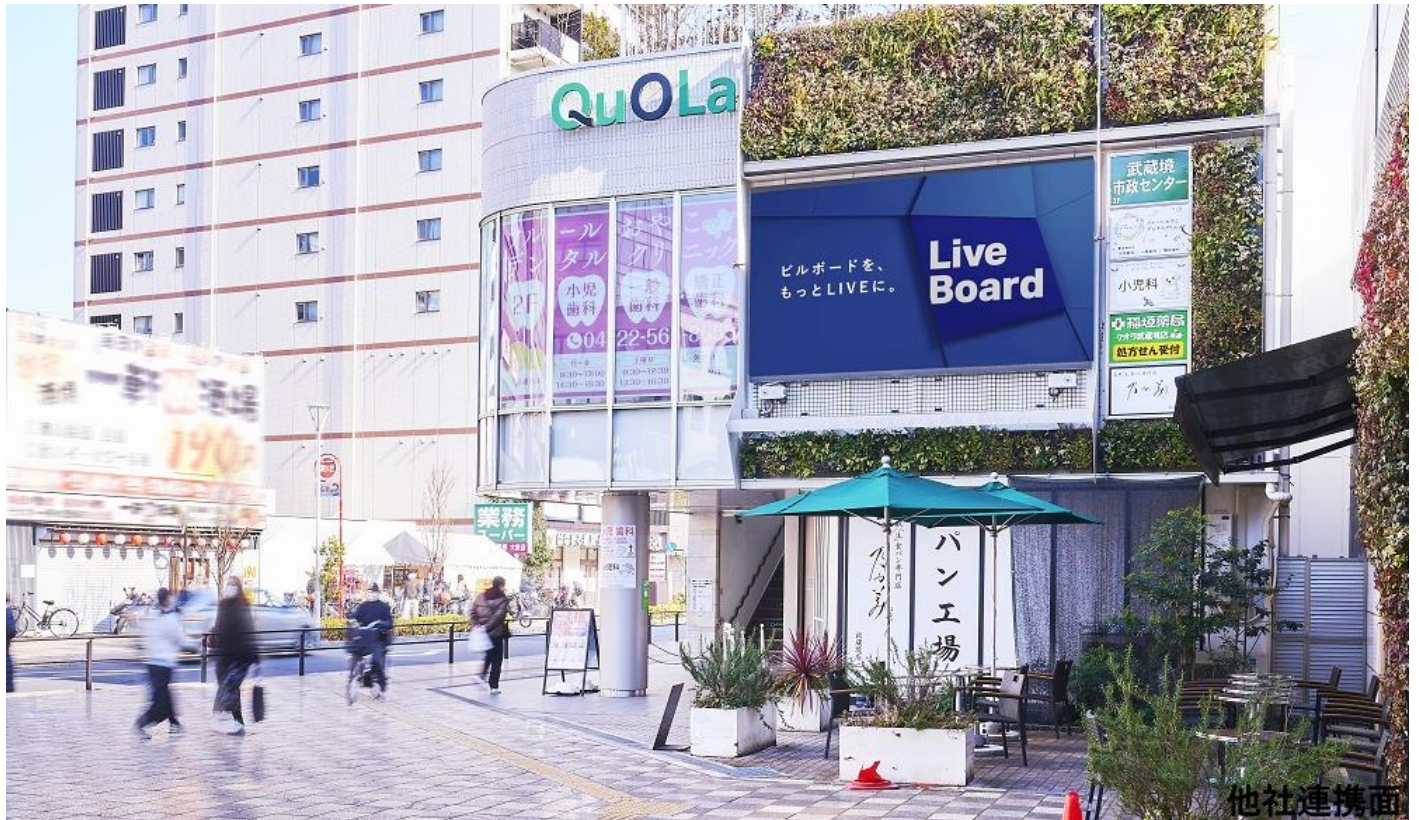
東京都・武蔵境 QuOLa ビジョン

株式会社 LIVE BOARD（本社：東京都渋谷区、代表取締役社長：櫻井 順 以下、LIVE BOARD）は、NTT ドコモの「docomo Sense TM ※1（旧名、顧客理解エンジン）」や「docomo data square ® ※2」等を活用し、LIVE BOARD 屋外ビジョンにおける分析を実施しています。年末が近づき仕事やプライベートが忙しくなると外食をする機会も増えていきます。気軽に行けて様々なメニューが揃うファミリーレストランを利用する方も多くいるのではないのでしょうか。そこで今回は、LIVE BOARD ネットワークの対象となる全国約 110 の屋外ビジョンから“ファミレスが好きな人”が多いビジョンをランキング化しました。