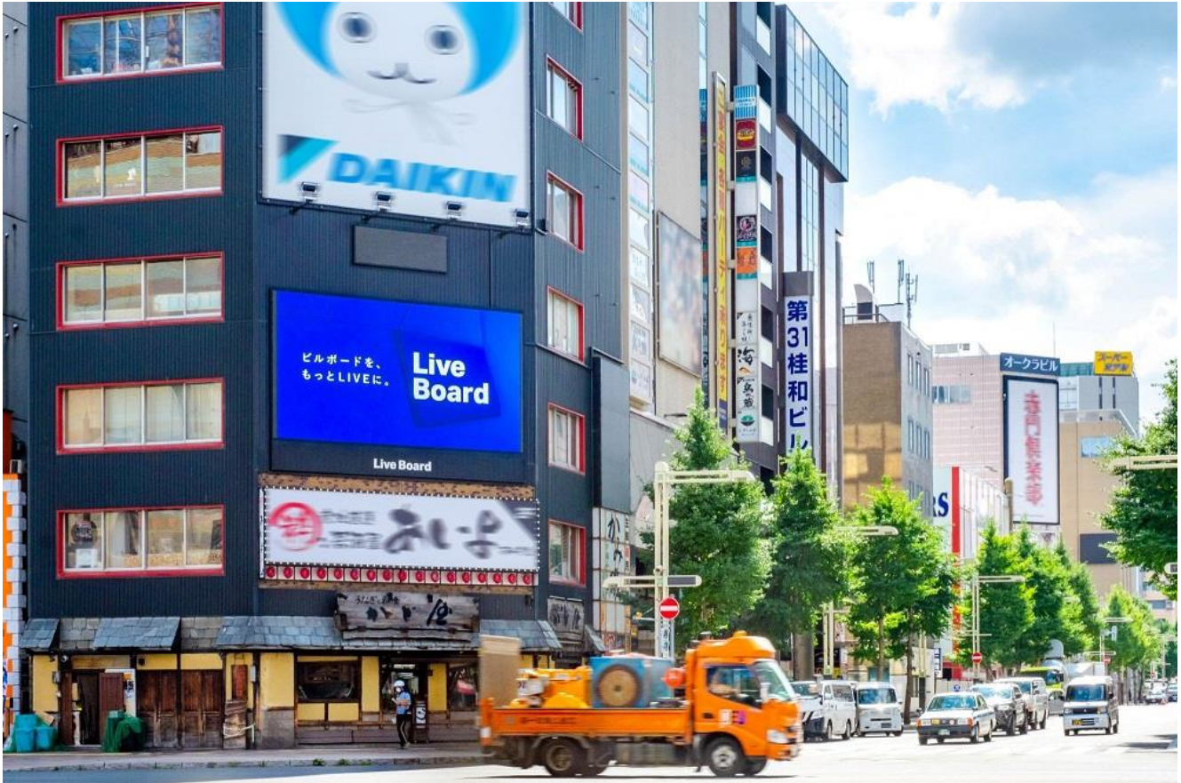
北海道・札幌_わたなべビル

株式会社 LIVE BOARD（本社：東京都渋谷区、代表取締役社長：高木 智広 以下、LIVE BOARD）は、NTT ドコモの「docomo Sense™※1（旧名、顧客理解エンジン）」や「docomo data square®※2」等を活用し、LIVE BOARD 屋外ビジョンにおける分析を実施しています。2月になるとデパートなどのお菓子売り場にはバレンタインに向けた商品が多く登場します。今年は9割以上の方が家族や友人、恋人へのプレゼントや、自分へのご褒美としてバレンタインギフトを購入するという結果※3も発表されています。そこで今回は、LIVE BOARD ネットワークの対象となる全国約110の屋外ビジョンから“チョコレートが好きな人”が多いビジョンをランキング化しました。